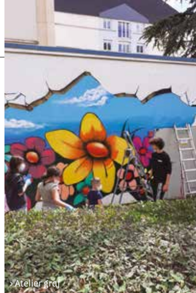
> Atelier graf