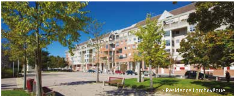
> Résidence Larchevêque

Les chantiers sont en cours, vous avez certainement aperçu ces panneaux aux abords des résidences.