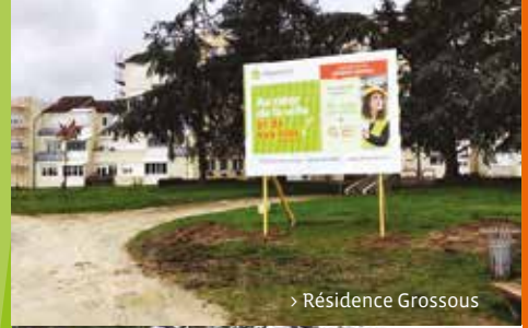
> Résidence Grossous