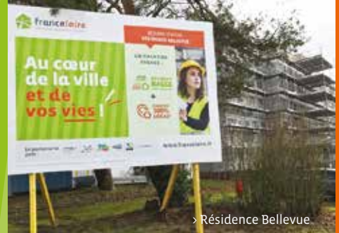
> Résidence Bellevue