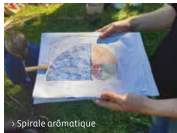
> Spirale aromatique