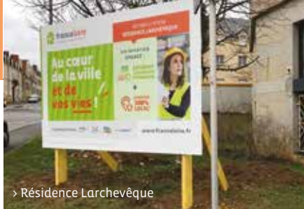
> Résidence Larchevêque