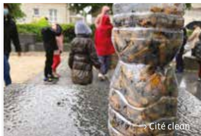
> Cité clean