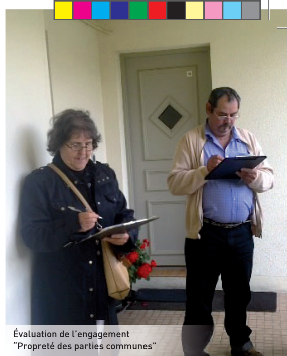
Évaluation de l'engagement "Propreté des parties communes"