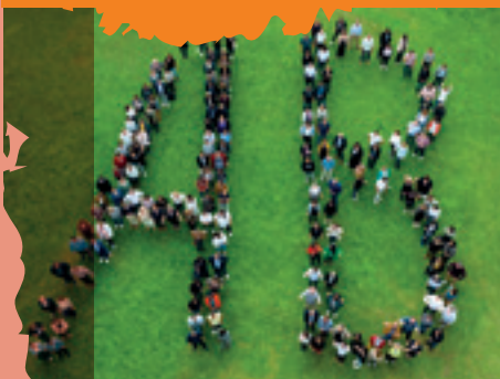
Convention Authentique Bâtitseur France Loire

locataires dont 3 332 nouveaux habitants en 2022